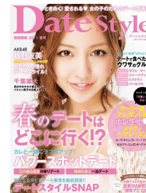
Date style 首都圏版 2011 春号